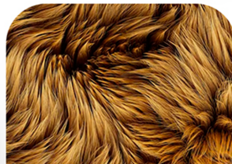
MARRON Y NEGRO LAR.