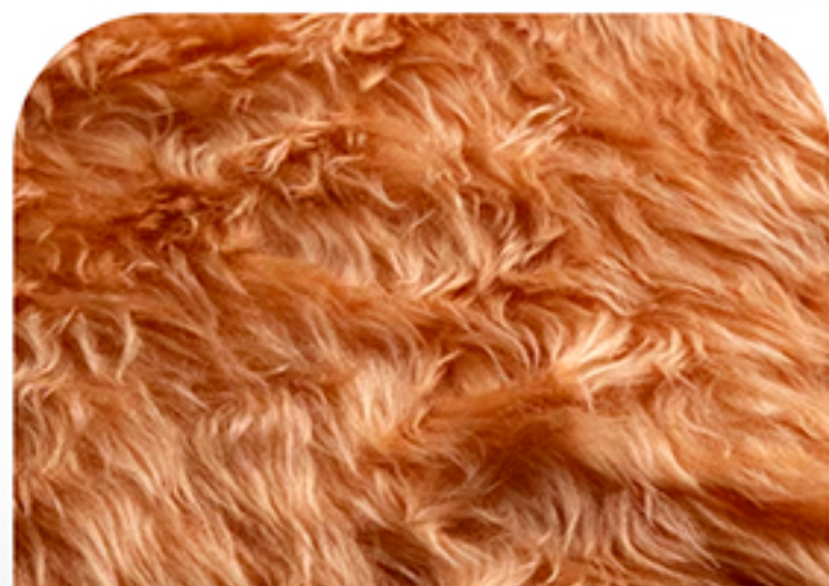
MARRON CLARO LARGO